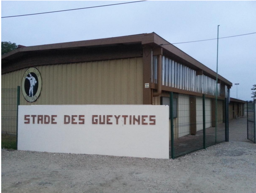
Salle Pierre de COUBERTIN